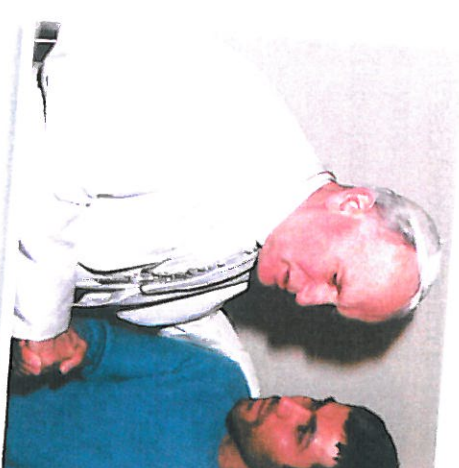
Jan Paweł II odwiedził w więzieniu Ali Agcę, który 13.05.1981 na placu św. Piotra w Rzymie dokonał nieudanego zamachu na życie papieża.