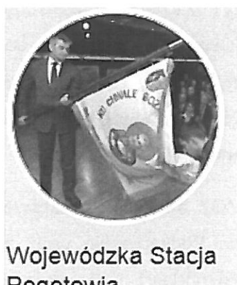
Wojewódzka Stacja Pogotowia

uzasadnieniem, że hasło to nawiązuje do Straży Pożarnej, w których to strukturach powstało Pogotowie Ratunkowe w Przemyślu.